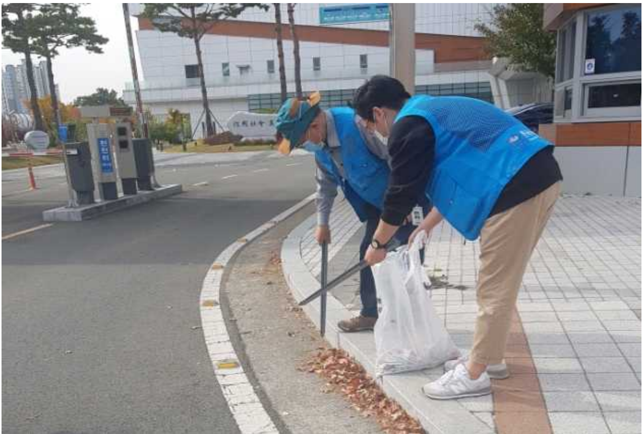
(사진4) 대구 혁신도시 일대 환경정화활동을 실시하고 있다.