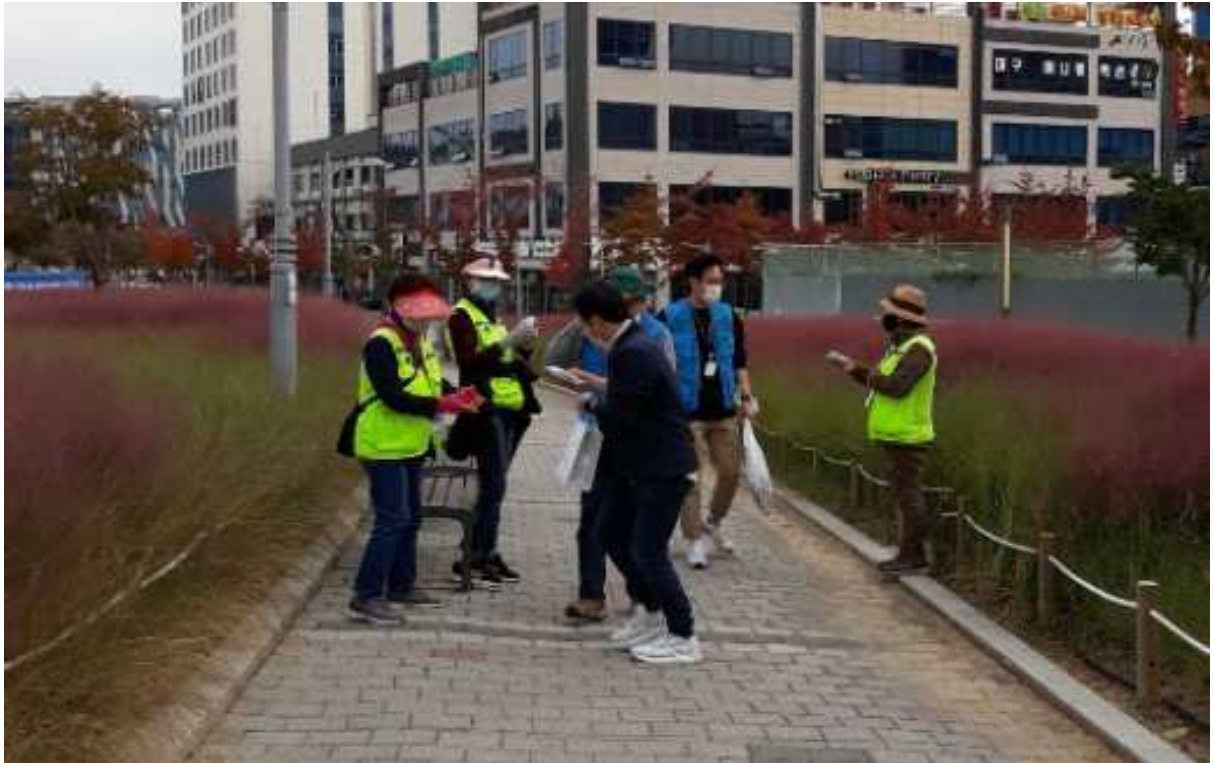
(사진3) 대구 혁신도시 일대 코로나19 예방캠페인을 실시하였다.