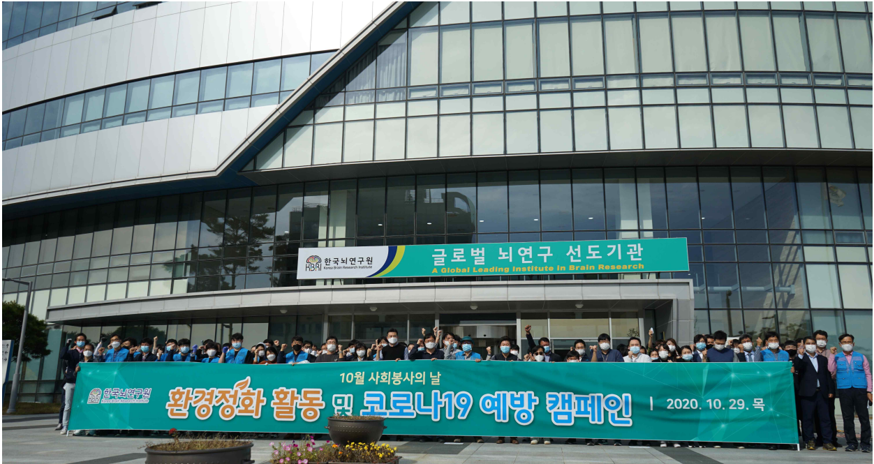
(사진1) 한국뇌연구원 서판길 원장과 직원들이 대구혁신도시 일대에서 코로나19 예방 및 환경정화를 위한 캠페인을 실시하였다.