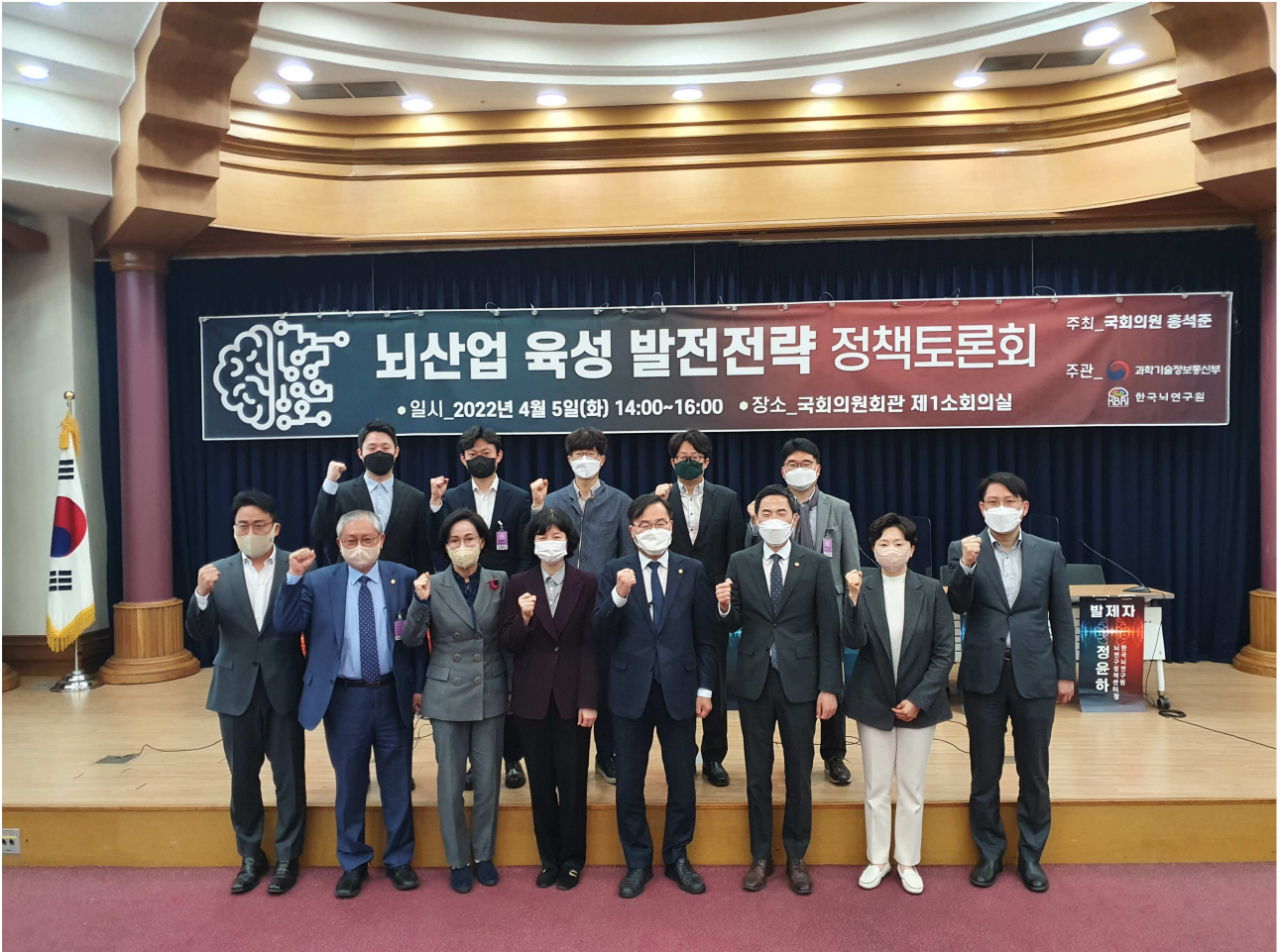
[정책토론회 기념 사진촬영]